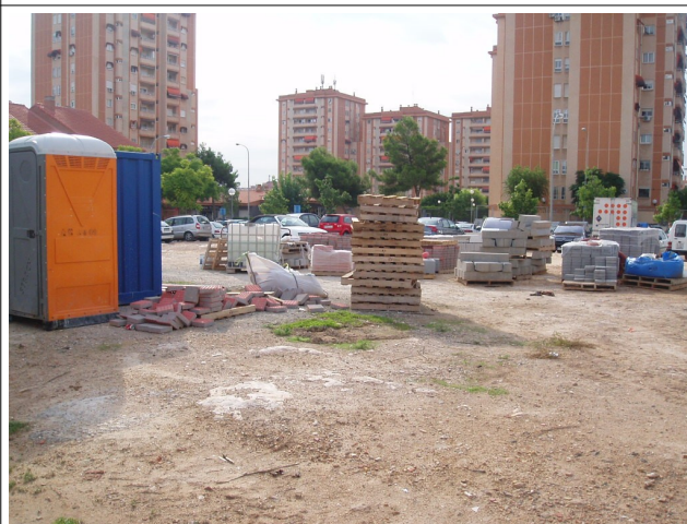
Estado del solar situado junto al CEIP Eusebio Sempere