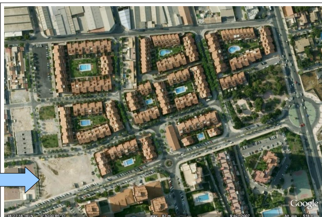
Plano de situación del solar indicado en el barrio Haygón 2